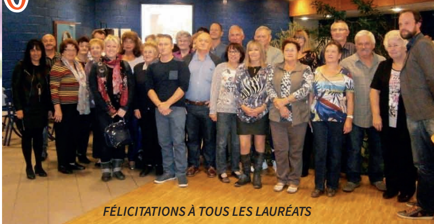
FÉLICITATIONS À TOUS LES LAURÉATS

Nous invitons les personnes qui souhaitent obtenir leur photo (présentée lors du diaporama) à se faire connaître en mairie.