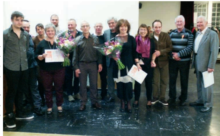
UN GRAND MERCI A TOUS LES DONATEURS !

9 premiers dons ont été enregistrés en 2015 !